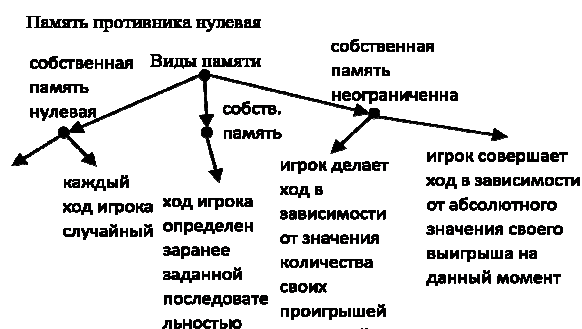
Рис.1. Игрок помнит только историю собственных ходов.

Итак, оптимальность стратегии зависит от ее цели. Целью игры является либо максимизация собственного выигрыша (игрок получает максимальный выигрыш), либо минимизация выигрыша противника (пусть я и не получу максимальный выигрыш, но и противник проиграет). Для проведения взаимодействия использовались чистые и смешанные стратегии, которые задаются набором правил. Правила зависят от глубины и типа памяти игрока. Рассмотрены два типа памяти — игрок помнит только собственные ходы и игрок помнит только ходы противника. На рисунке 1 показаны виды чистых стратегий при условии, что игрок помнит только историю собственных ходов.