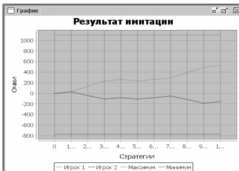
Рис. 2. Визуализация результатов игры для двух стратегий с нулевой и ограниченной памятью при фиксированных значениях поощрения/штрафа

Проведем аналогичный эксперимент несколько раз (условия проведения эксперимента те же) и проанализируем полученные результаты.