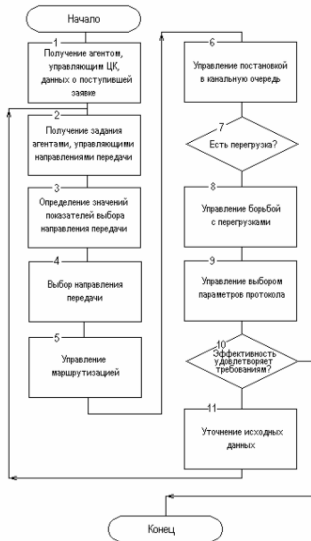
Рис. 3. Блок-схема алгоритма функционирования МАС ЦК.